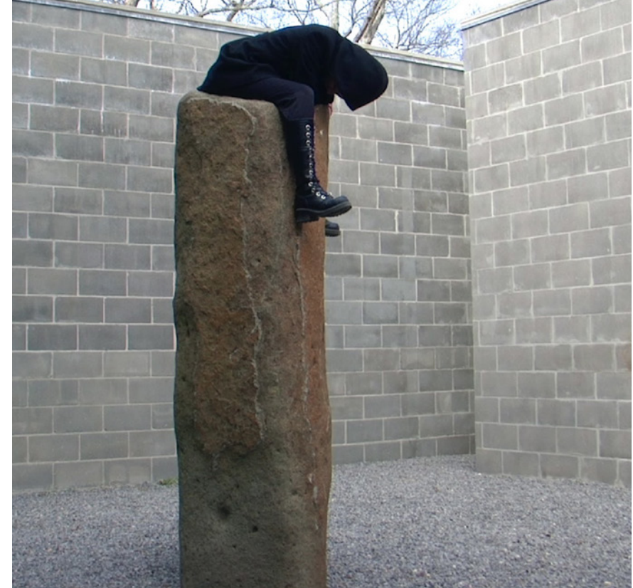
Watermill Center - Permanente, 2009/2018 Performance de larga duración (reactivación); mdf

De la misma manera la propuesta abraza la intención de Salmona, al abrir las ventanas y volver al estado original de su arquitectura, como una invitación a interactuar con la ciudad y con sus complejas dinámicas, desde el interior hacia el exterior.