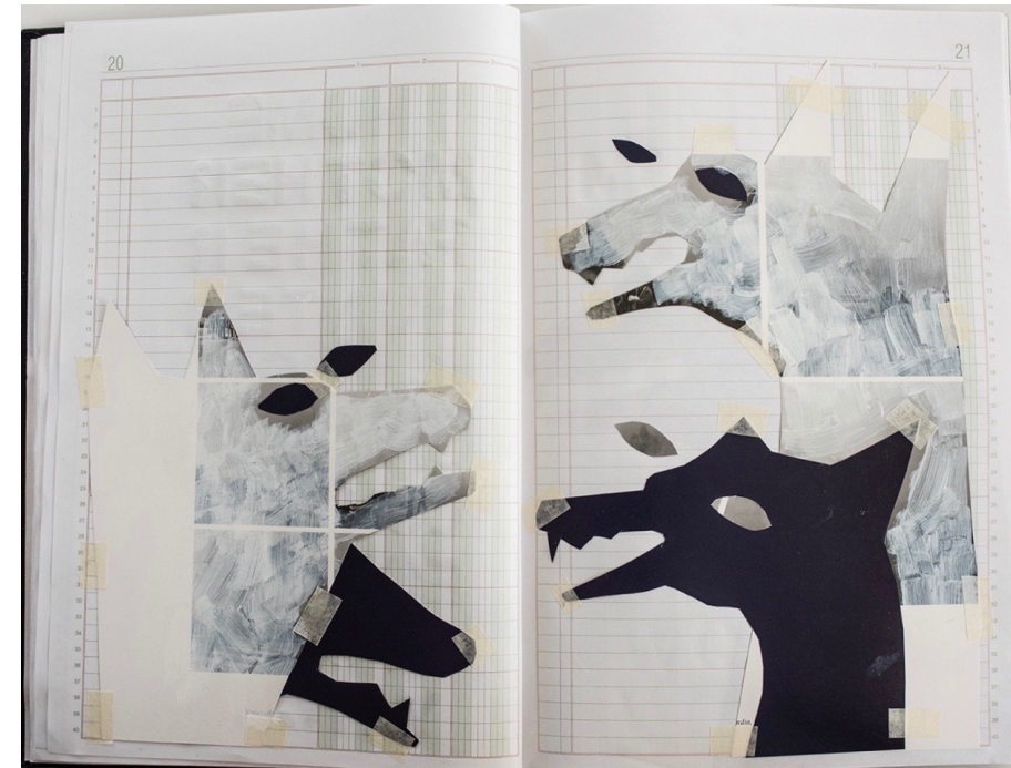
Entonces soy el lobo, 2018 Performance de marionetas con sonido y video

Este ciclo ocupa el subsuelo del museo, donde se muestra un grupo de videos y performances en vivo. Entonces soy el lobo es una obra creada para esta exposición donde Arjona toma como referente el cuento popular La caperucita roja en el que una niña abandona el camino que debe tomar para entrar en el bosque misterioso donde encuentra una amenaza que cambia de forma (el lobo) disfrazada de algo familiar y reconfortante (la abuelita). La artista crea una obra compuesta por títeres de sombras, una banda sonora y fragmentos textuales de dibujos y poesía en la que un sujeto singular ocupa múltiples identidades, el lobo. Se explora esta comprensión del yo, convirtiéndose de forma simultánea en amenaza y salvador, víctima y agresor, salvaje y civilizado.