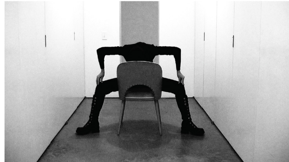
Watermill Center - The beauty of 4 legged animals, 2009 4 videos mudo, 12:39 minutos en loop; 36 fotografías en blanco y negro