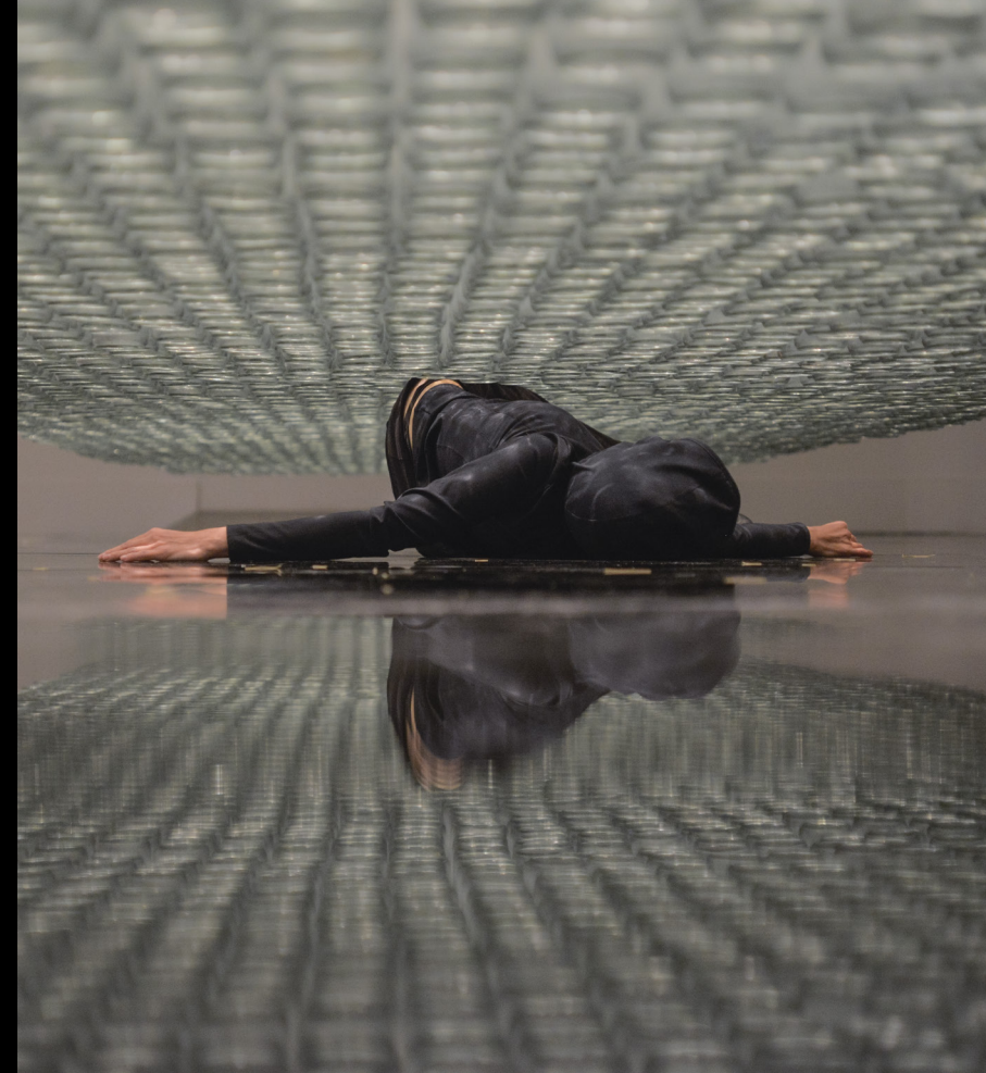
Línea de vida, 2016 Performance de larga duración: botellas de vidrio, acrílico y cuerdas enceradas

Al igual que los leones marinos, la artista se desliza lentamente por este espacio mientras su cuerpo roza las botellas que generan sonidos casi acuáticos como el oleaje del mar.